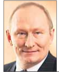
Jaak Aaviksoo Eesti Vabariigi haridus- ja teadusminister

Millisena näete Teie, Jaak Aaviksoo, uue haridus- ja teadusministriina waldorfkoolide rolli Eesti haridussüsteemis ning nende koolide toetamisvõimalusi?