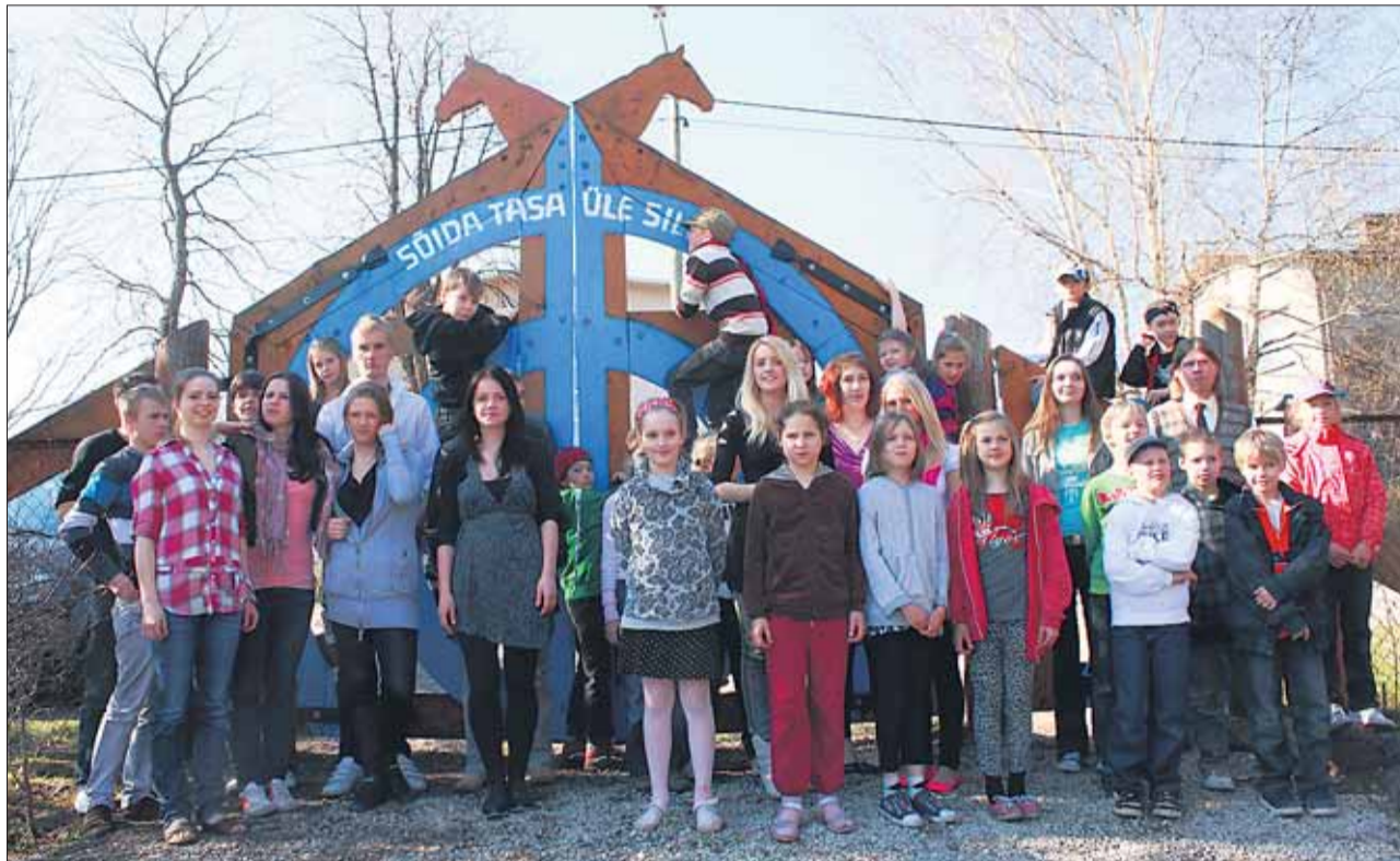
Kooliväru ehitamine on hoolt ja armastust nõudev töö nagu koolis õppimine ja õpetaminegi. Tartu Waldorfgümnaasiumi 12. klassi õpilased 9 aasta eest valmistatud kooliväru ees koos eeskujuvõtjatega kolmandast klassist.

Waldorfkoolis õpetajana töötamine esitab küllalt suure väljakutse, sest sobiv õppesisu tuleb valida õppekava üldteemadest lähtudes konkreetsele klassile ja vahel isegi üksikule õpilasele ise, leida ise ka sellele sobiv vorm (waldorfkoolides üldiselt ei kasutata õpikuid, oluline koht on jutustamisel ning teemade „piltlikustamisel“) ning arvestada ainetevahelist lõimumist ja laste arenguvajadusi. Pedagoogilise „kuns-timeisterikkuse“ tõstmiseks tuleb õpida kolleegidelt ja end pidevalt täiendada. Taoline enesearengut soodustav keskkond kajastub ka hinnangutes. Peaaegu kõigile vastanud õpetajatest meeldis nende töö (98% väitega nõus) ning leiti, et töötamine koolis võimal-