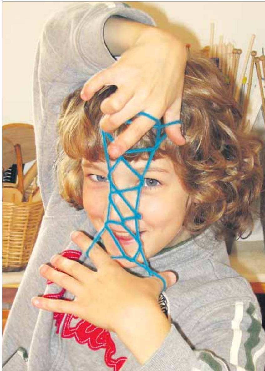
Rõõm võib suur olla ka pealtnäha lihtsate asjade valmistamisest.

Eneselegi märkamatult olen ära seletanud ka elurõõmu vähema venna, koolirõõmu põhiolemuse. Iga laps tahab õppida praktiliselt ja teguselt, teistega koos ja parajal määral. Viimast kooliveerandit Johannese Koolis Rosmal alustanud III Loovusnädal oli selle järjekordseks tõestuseks. Kui palju rõõmu töid külalisõp-